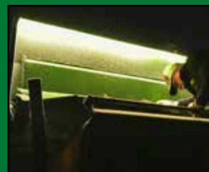
LUMINI IN BUNCARE