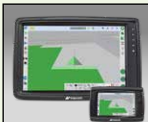
MONITOR TOPCON XD & XD